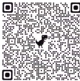
QR Code สมัคร