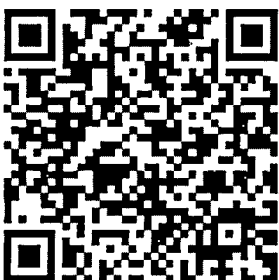
รายละเอียดหลักสูตร และคำรับรอง

ศูนย์คุณธรรม (องค์การมหาชน) https://www.moralcenter.or.th/