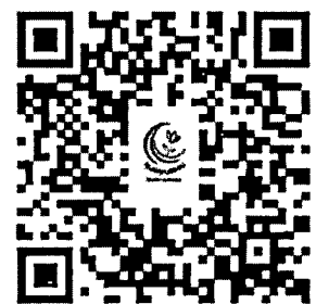
QR Code ลงทะเบียนกลุ่มที่ ๒ ครูทั่วไปที่สนใจ สังกัด สพฐ./สข./กทม.