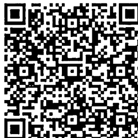
QR Code ลงทะเบียนกลุ่มที่ ๑ ครูที่ปรึกษาโครงการงานคุณธรรม เฉลิมพระเกียรติ เยาวชนไทยทำดี ถวายในหลวง (ระดับประเทศ) เฉพาะปี ๒๕๖๓ - ๒๕๖๘